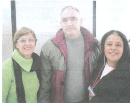
Parte da equipe do SER

A equipe será acionada pela população em geral e irá ao local para abordar o usuário, buscando obter o máximo possível de informa-