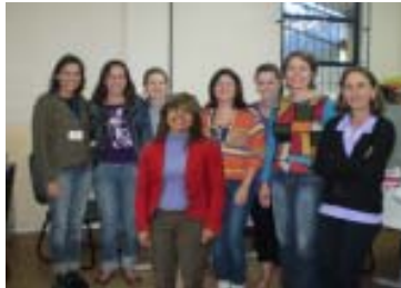
Parte da equipe

assistência social propicia a realização de um atendimento mais efetivo, pelo fato de estar mais próximo das pessoas que necessitam de auxílio e desta forma é possível ainda a integração de todos os serviços oferecidos a região.