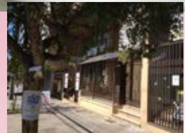
Intervenção alusiva à "III Semana Municipal da Paz" e ao "Setembro Amarelo" (dedicado à prevenção do suicídio):